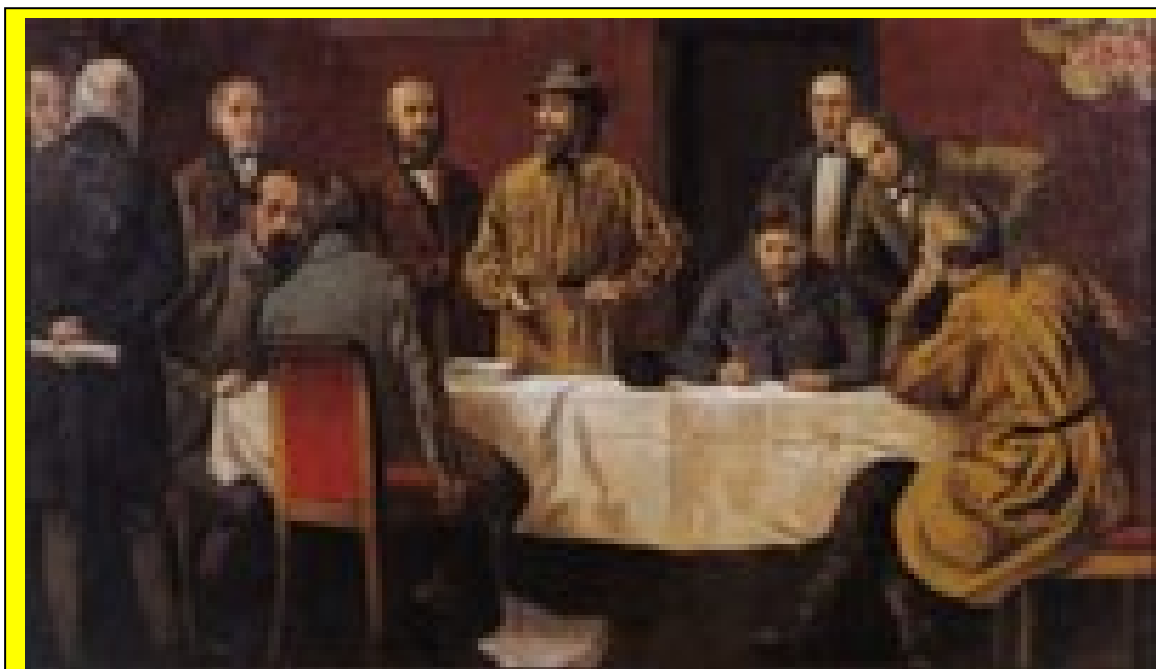
Hecker und die Revolutionäre (Bild: Städtisches Reißmuseum Mannheim)

Der Chronist berichtet auch über die Strafen, welche die Revolutionäre nach ihrer Niederlage wegen „Treulosigkeit gegen das Fürstenhaus“ erdulden mussten. Die Todesstrafe wurde vielfältig praktiziert, die Zuchthäuser waren überfüllt, preußische, hessische und württembergische Truppen waren monatelang als Besatzungssoldaten im Klettgau stationiert. Jedem, der sich diese historischen Gegebenheiten in seiner Fantasie ausmalen kann und der die alemannische Volksseele kennt, wird klar, dass darin zumindest teilweise die alten und oft noch heute spürbaren pauschalen Vorurteile und Ressentiments z. B. gegen „die Württemberger“ und „die Preußen“ verwurzelt sind, als die Mächte, welche damals die Revolutionsbestrebungen des Jahres 1848/49 niederschlugen.