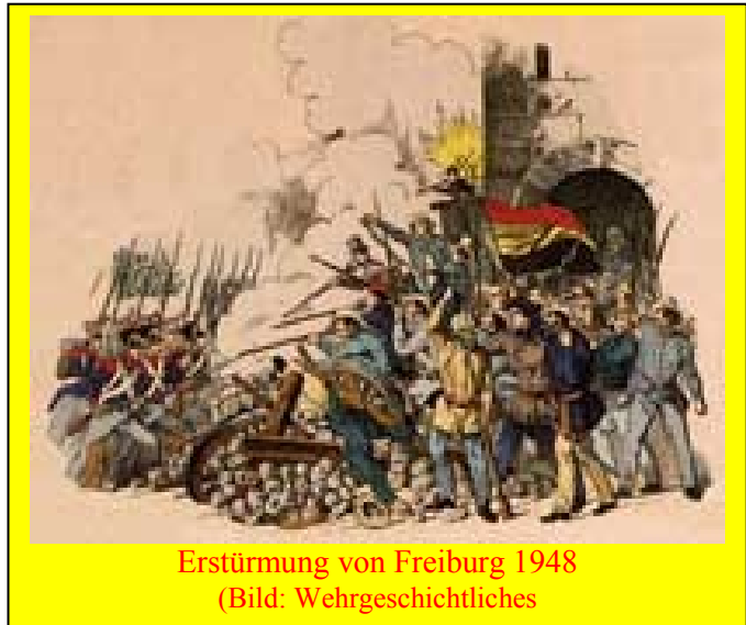
Erstürmung von Freiburg 1848